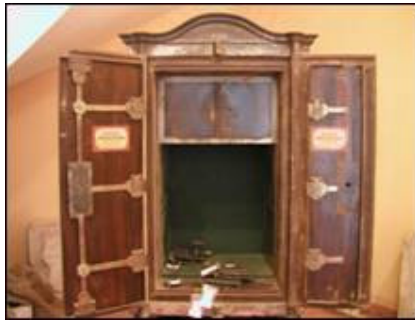
Frontalni prikaz sefa sa otvorenim vratnicama