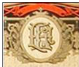
Detalj s naljepnice

Naljepnice koje je Fleischer koristio za obilježavanje svojih sefova, iako različite u odabiru kolorita, ponavljaju gotovo identičan sistem uobičajenog uokviravanja promidžbenih poruka kao što je onaj na naljepnici M Adlersfluegela.