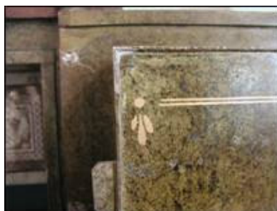
Detalj s unutrašnje strane vratnice

Različitosti ovog sefa ne završavaju na polikromiji slikarskog karaktera. Gornja polica, od sveukupno tri, je u ovom slučaju natkrivena metalnom gravurom s dekorativnim elementima koji su manualno izvedeni jetkanjem. Također, ovdje umjesto uobičajene nalijepljene etikete proizvođača s unutrašnje strane vratnice, nailazimo na zašarfljenu metalnu pločicu s natpisom proizvođača.