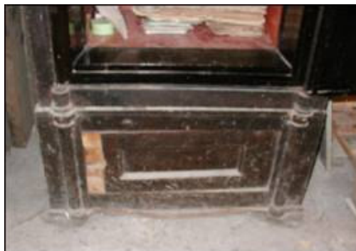
Prikaz originalnog postolja Wertheimovog sefa

Sef stoji na relativno sačuvanom originalnom postolju, u ruhu je vanjske originalne polikromije, dok je samo donja polica u unutrašnjosti prebojena crvenom bojom. Ispunjen je izvornim obiteljskim dokumentima i spisima pisanih krasopisom.