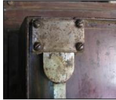
Detalj s lijevih vratnica sefa s prikazom metalne gravure (zatečeno stanje)