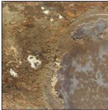
Prikaz korodirane metalne površine s ostacima grunda i polikromije

Slojevi grunda, polikromije i pozlate na vanjskim stranama tanko su nanesen na način da ne amorfiziraju bogate profilacije. Njihova struktura u velikoj se mjeri delokalizirala. Slojevi su bubrili porastom vlage u okolnoj atmosferi i ljuštili se njezinim opadanjem. Oštećenja navedenih slojeva obilna su i nepovratna, te besmislena u vidu konzervacije. Ona zahtijevaju kompletnu restauraciju kako bi objekt ponovno bio estetski čitljiv.