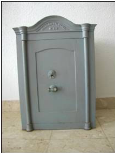
Frontalni prikaz sefa smještenog u Turističkoj zajednici u Kaštel Novom

U Turističkoj zajednici u Kaštel Novom nalazi se jednovratni sef bez sačuvanog postolja koji iznad vratnica ima izliven natpis M. Adlersfluegel . Ovaj sef manjih je dimenzija od ranije navedenih.