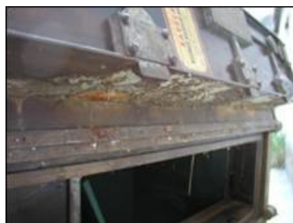
Prikaz oštećenja na spojevima vratnica sefa obitelji Vitturi

Najveća oštećenja nalaze se upravo na mjestima gdje se vlaga zadržavala, kao što su međuprostori između vratnica i obližnjih slojeva konstrukcije na koju one prijanjaju, dok su najmanja oštećenja na lijevoj bočnoj strani na koju je predmet bio oslonjen gdje nije bio u velikoj mjeri izložen agresivnim atmosferijama.