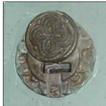
Prikaz funkcionalne brave na vanjskoj strani vratnice