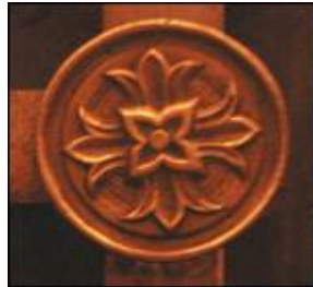
Figuralni metalni ukras na unutrašnjoj strani vratnice