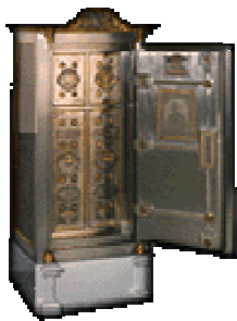
20.000-ti sef tvrtke Wertheim, 1869.g.

Godine 1869. naveliko je proslavljeno dovršenje 20.000-tog sefa. Na gozbi sa 1200 pokrovitelja na čelu s predstavnicima oružanih snaga i vlade, predstavnika banaka i industrije, te umjetnosti i znanosti slavili su s čitavim osobljem. Josef Strauss, isključivo za ovaj događaj, komponirao je polku « Feuerfest ».