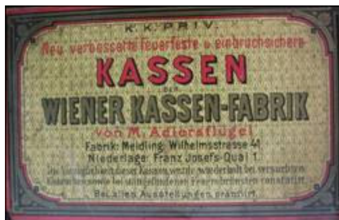
Prikaz naljepnice s unutrašnje strane vratnice

Na jednom i na drugim vratnicama, s unutrašnje strane, nalaze se promidžbene naljepnice proizvođača Mathiasa Adlersflügela Bečke tvornice sefova. Za razliku od ranije prikazane naljepnice istoga proizvođača, ova je znatno siromašnija u pogledu dizajna i grafičkoga uređenja. Naime, nisu korišteni nikakvi ukrasni dodaci već je akcent na promidžbenoj poruci i jednostavnosti upotrijebljenoga stila.