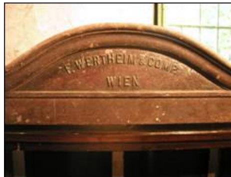
Prikaz eliptične profilacije iznad vratnica Wertheimova sefa s izlivenim natpisom proizvođača

Na eliptičnoj profilaciji iznad vratnica sefa nalazi se natpis proizvođača.