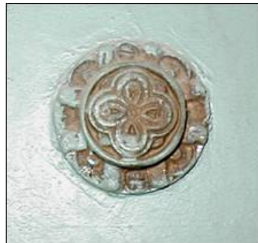
Prikaz fiktivne brave na vanjskoj strani vratnice

Izvana na sefovima nije sačuvana originalna polikromija, već su oni tijekom boravka u muzeju bili prebojani, što prvenstveno možemo uočiti na ukrasima koji prekrivaju brave.