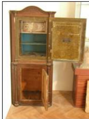
Sef s odškrnutim vratnicama

Naime, oponašanje furnira ovdje se zadržava samo na vanjskim površinama sefa, dok na unutrašnjim nailazimo na slobodniji motiv crnih i smeđih mrlja koje se pretapaju na žutoj pozadini. Polikromija je u cijelosti relativno dobro sačuvana, a to uključuje i pozlaćene dijelove, kao što su sistemi uokviravanja vratnica (iznutra i izvana) kod kojih se jasno očituju potezi kista.