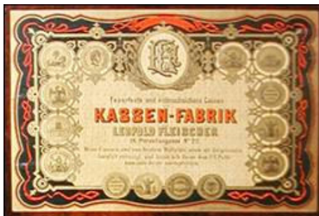
Naljepnica s Fleischerovih sefova iz Muzeja hrvatskih arheoloških spomenika u Splitu

Još jedan istaknuti proizvođač koji je svojim asortimanom obilježio ovo područje bio je Leopold Fleischer . Rođen je 1831. u Muehlbachu kod Eppigena, a umro 1907. 4