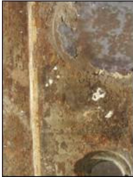
Detalj desne vratnice s rikazom ostatka grunda, polikromije i pozlate

Jedino su vidljive strane obogaćene vizualnim dodacima u vidu grunda, polikromije i pozlate, dok su stražnja i donja strana predmeta premazane crnom bojom. Pozlatu možemo pratiti na pravilnim konkavnim urezima koji uokviruju brave na jednim i na drugim vratnicama, kao i na onima koji obrubljuju vanjske konture vratnica.