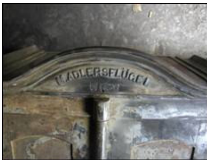
Eliptična ukrasna profilacija s natpisom proizvođača

Samo je prednja strana sefa, iznad vratnica, produžena u vidu eliptične ukrasne profilacije s izlivenim natpisom proizvođača koji slijedi oblik profilacije.