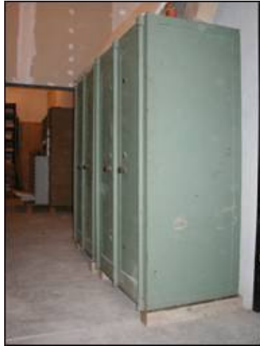
Sefovi iz M.H.A.S.-a

U depou muzeja Hrvatskih arheoloških spomenika u Splitu (M.H.A.S.) čuvaju se dva sefa proizvođača Leopolda Fleischera , s malenim diferencijama u izvedbi (bez postolja su, nemaju na naličju izvedenu ovalnu profilaciju) i nešto većih dimenzija.