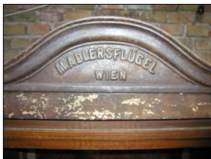
Prikaz eliptične profilacije

S vanjske strane originalna polikromija relativno je dobro sačuvana, dok je s unutrašnje strane, u vidu imitacije furnira, očuvana u većoj mjeri.