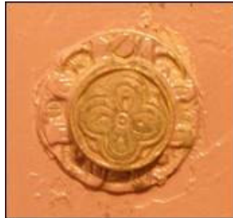
Prikaz fiktivne brave na vanjskoj strani vratnice

Iako većih dimenzija, on strukturno podsjeća na sef obitelji Vitturi dok se njegovi ukrasni elementi mogu uspoređivati s onima na sefovima u M.H.A.S.-u.