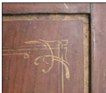
Detalj s vanjske strane vratnice

Naime, oponašanje furnira ovdje se zadržava samo na vanjskim površinama sefa, dok na unutrašnjim nailazimo na slobodniji motiv crnih i smeđih mrlja koje se pretapaju na žutoj pozadini. Polikromija je u cijelosti relativno dobro sačuvana, a to uključuje i pozlaćene dijelove, kao što su sistemi uokviravanja vratnica (iznutra i izvana) kod kojih se jasno očituju potezi kista.