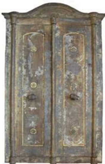
Frontalni prikaz sefa obitelji Vitturi u zatečenom stanju

Izvorno mjesto sefa bilo je u kaštelu spomenute plemićke obitelji, međutim, iz nepoznatih razloga, predmet je bio premješten sredinom prošlog stoljeća, te je zbog očitog neznanja o njegovoj povijesnoj vrijednosti, kontinuirano mijenjao korisnike pa tako i namjene.