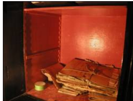
Prikaz donje unutrašnje police