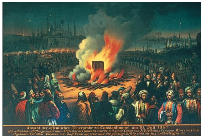
Prizor požarnog pokusa iz 1857, Carigrad

1857 godine Franz Wertheim organizirao je još jedan uspješan požarni pokus u Carigradu, u prisutnosti sultana i čitavog sekretarijata.