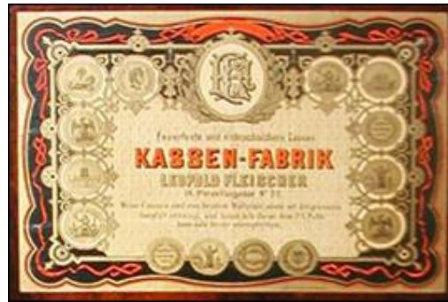
Naljepnica proizvođača Leopolda Fleischera s unutrašnje strane vratnice sefa

Datiraju iz vremena fra Luja Maruna , osnivača starohrvatske arheologije (1857-1939), te je moguće da su njegova narudžba. 7 Njihov značaj u spomenutom muzeju još uvijek nije poprimio nikakvu povijesnu ili umjetničku vrijednost, naime uloga im je i dalje funkcionalna.