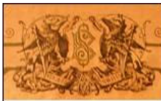
Detalj s naljepnice

Njegova naljepnica jednostavnim dizajnom pomalo odudara od ranije prikazanih naljepnica, a da je u pitanju skromnost pokazuje i sam odabir neplastificiranog papira. Međutim, prvi put nailazimo na demonstrativni prikaz testiranja sefa na požar, smješten u donjem djelu naljepnice.