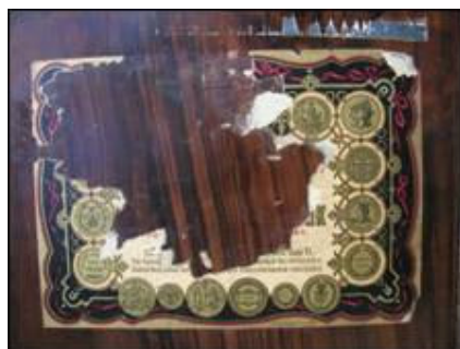
Djelomično sačuvana naljepnice sefa iz Turističke zajednice

Nema sačuvano postolje, a s vanjske strane bio je bojan sivom bojom u nekoliko navrata. Prema sačuvanim ostacima naljepnice proizvođača jasno je da se ponavlja ista shema grafičkog uređenja kao i kod ranije prikazana Adlesfluegelova sefa u vlasništvu obitelji Kuzmanić.