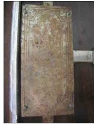
Detalj s desnih vratnica sefa s prikazom figuralnog metalnog ukrasa(zatečeno stanje)

Unutrašnjost je podijeljena u dva dijela. Gornji dio je izveden u obliku ladice s dvostrukim vratnicama, a donji sadrži mobilnu metalnu policu.