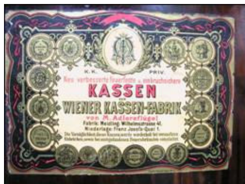
Prikaz naljepnice proizvođača s unutrašnje strane vratnice

Ovdje je ipak riječ o nešto bogatije izvedenoj naljepnici M. Adlersfluegela od one na sefu Vitturi. Sadržava (kao i Wertheimova) zbirku osvojenih priznanja i medalja sa raznih natjecanja (Trst 1872. i 1882., Beč 1880.)