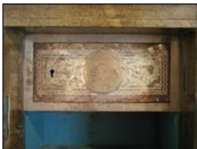
Prikaz unutrašnje metalne gravure

Različitosti ovog sefa ne završavaju na polikromiji slikarskog karaktera. Gornja polica, od sveukupno tri, je u ovom slučaju natkrivena metalnom gravurom s dekorativnim elementima koji su manualno izvedeni jetkanjem. Također, ovdje umjesto uobičajene nalijepljene etikete proizvođača s unutrašnje strane vratnice, nailazimo na zašarfljenu metalnu pločicu s natpisom proizvođača.