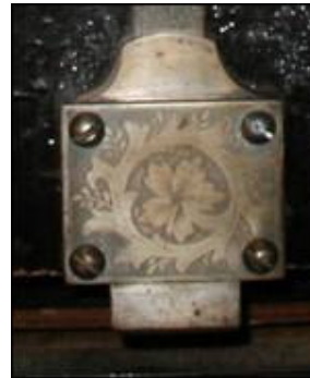
Metalna gravura na unutrašnjoj strani vratnice

Izvana na sefovima nije sačuvana originalna polikromija, već su oni tijekom boravka u muzeju bili prebojani, što prvenstveno možemo uočiti na ukrasima koji prekrivaju brave.