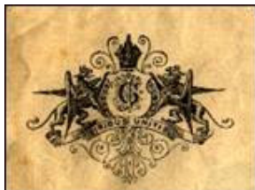
Detalj iz prodajnog kataloga proizvođača Carla Jahna

Još jedna zanimljivost u istraživanju proizvođača sefova na području Splita, Kaštela i Trogira izvorni je prodajni katalog čuvan u Muzeju Grada Kaštela, proizvođača Carla Jahna. U njemu su prikazani različiti modeli sefova, njihove dimenzije, svojstva i cijene. Također, proizvođač je priložio naputak za korištenje sefova kao i svoju adresu u slučaju potrebe klijenta.