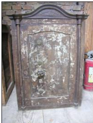
Frontalni prikaz Adlersfluegelova sefa

Sef Mathiasa Adlersfluegela je manjih dimenzija od prethodnog. Unutrašnjost je podijeljena policama u tri dijela, od kojih je gornji, analogno svim sefovima zatvoren vratašcima s bravicom.