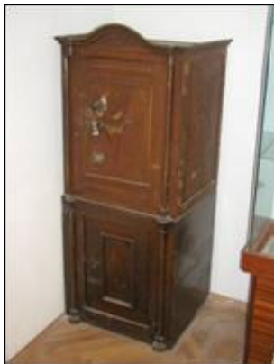
Prikaz sefa iz Podvorja, Kaštel Sućurac

U Podvorju u Kaštel Sućurcu nalazi se jednovratni sef na sačuvanom originalnom postolju s vratašcima proizvođača Theodora Wiese . Ovaj sef se polikromijom ponešto razlikuje od ostalih.