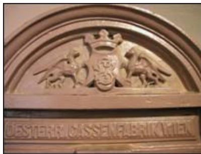
Eliptična profilacija iznad vratnica

Na prikazanim ukrasima koji prikrivaju brave jasno je da sef izvana nema sačuvanu izvornu polikromiju, već je bio prebojen u skladu s obližnjim namještajem.