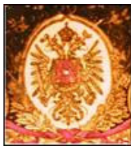
Detalj s naljepnice

Na Wertheimovim se proizvodima, kao i kod svih ostalih proizvođača, nalazi naljepnica tvrtke s promidžbenim obilježjima (poruke i apeli na sigurnost, adresa proizvođača, premije, osvojene nagrade i sl.).