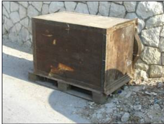
Prikaz zatečenog smještaja sefa obitelji Vitturi

Sef obitelji Vitturi mjesecima se nalazio u neadekvatnim i nekontroliranim vanjskim vremenskim uvjetima, izložen izrazitim oscilacijama temperature i relativne vlažnosti.