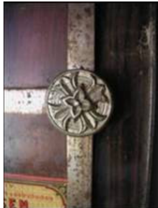
Detalj s lijevih vratnica sefa s prikazom metalne gravure (zatečeno stanje)