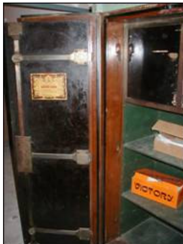
Prikaz unutrašnjosti sefa

Unutrašnjost im je izvedena sa standardnim obilježjima svih proizvođača kao što su ukrasi i metalne gravure koji prekrivaju mehanizme otvaranja i brave, raspored polica i sl. Iznutra je na vratnicama sačuvana originalna polikromija imitacije drva.