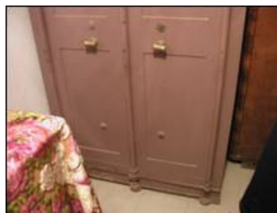
Donji dio sefa