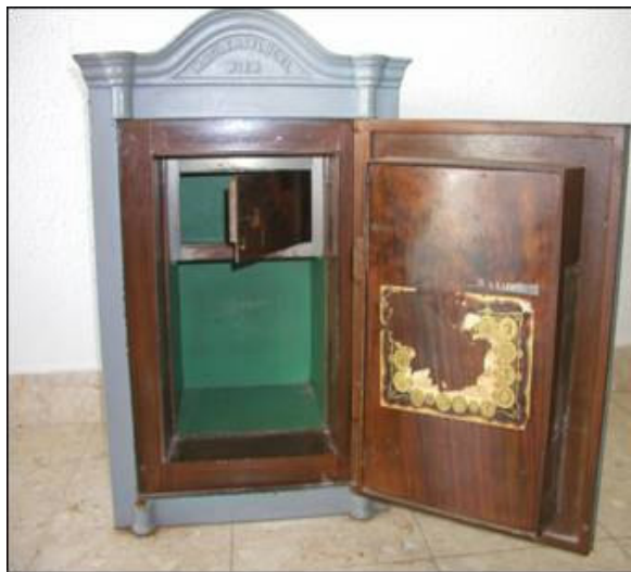
Sef s odškrnutim vratnicama

Nema sačuvano postolje, a s vanjske strane bio je bojan sivom bojom u nekoliko navrata. Prema sačuvanim ostacima naljepnice proizvođača jasno je da se ponavlja ista shema grafičkog uređenja kao i kod ranije prikazana Adlesfluegelova sefa u vlasništvu obitelji Kuzmanić.