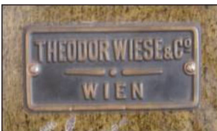
Metalna pločica s natpisom proizvođača