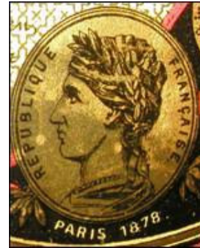
Detalj s naljepnice

Sef je u kuću, prema riječima vlasnika, dospio oko 1930.-tih godina, iako je moguće da je njegov postanak raniji, naime, posljednje spomenuto natjecanje na kojem je sudjelovao proizvođač bilo je 1878. u Parizu.