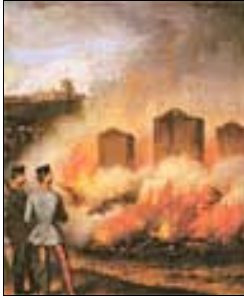
Prizor požarnog pokusa iz 1853., Beč

Brojnim patentima i izumima stekao je internacionalan uspjeh. Bio je istaknuta ličnost koja je opskrbljivala čitavo Austrijsko tržište svojim uslugama. On je taj koji je utro putove novoj reklamnoj prirodi poslovanja.