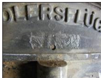
Detalj s eliptične profilacije s prikazom otučenog natpisa

Ispod njega nalazi se u ravnini sa središnjim profilom, koji odvaja vratnice jednu od druge, kružna šupljina čiji sadržaj nije sačuvan. Za vrijeme restauracije, na području oko šupljine, otkriveni su svjesno nanaseni tragovi dlijeta koji su otukli izliveni natpis WIEN . Analogijom će se utvrditi da šupljina nije integralni dio predmeta, već je nastala tijekom njegova boravka u zemlji za koju je naručen.