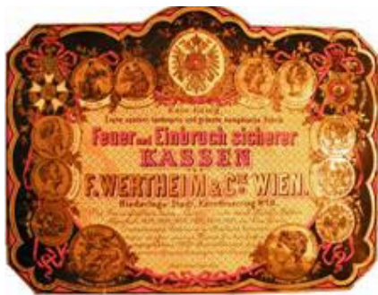
Naljepnica s Wertheimovog sefa iz kuće obitelji Kuzmanić iz Kaštel Novog

Godine 1910. tvrtka Wertheim uvodi još jednu inovaciju i započinje s proizvodnjom sefova otpornih na rezanje plamenikom (brenerom). 2