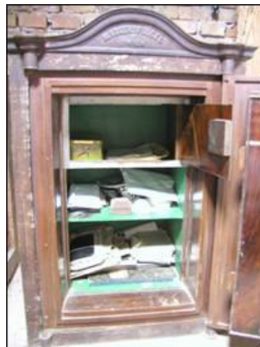
Sef s otvorenom vratnicom

S vanjske strane originalna polikromija relativno je dobro sačuvana, dok je s unutrašnje strane, u vidu imitacije furnira, očuvana u većoj mjeri.