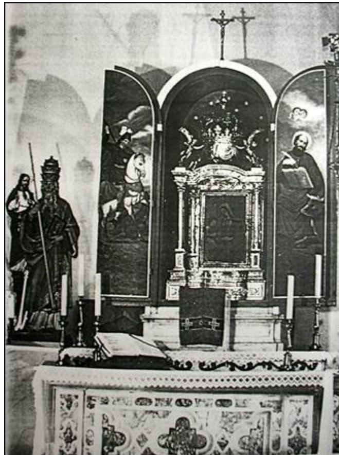
Prikaz sefa postavljenog na glavni oltar crkve »Gospa na Hladi» u Kaštel Sućurcu

U crkvi «Gospa na Hladi» na groblju u Kaštel Sućurcu, kao sastavni dio glavnog oltara, nalazi se sef tvrtke Wertheim . U crkvu je dospio 1879. godine kao narudžba mještana. 8