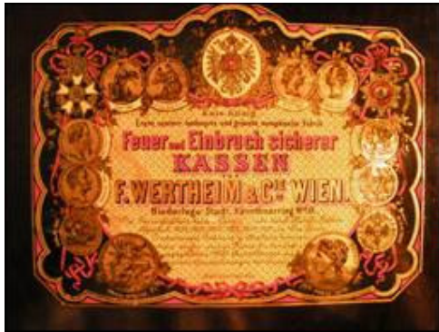
Naljepnica s unutrašnje strane vratnice sefa

Wertheimov sef izgledom ukazuje na nešto sofisticiraniju i brižniju izvedbu od ranije navedenih sefova. Čak je i sama naljepnica dekorativnije uređena i sadržava zbirku osvojenih zlatnih medalja s brojnih natjecanja na kojima se predstavljao proizvođač (Beč 1849., Petrograd 1849., Pešta 1863., Dublin 1865., Pariz 1867. i 1878.).