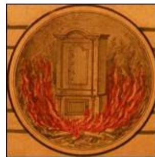
Detalj s naljepnice

Njegova naljepnica jednostavnim dizajnom odskače od naljepnica ostalih proizvođača, a da je u pitanju skromnost, pokazuje i odabir mat papira. Međutim, kako je već ranije istaknuto, prvi put nailazimo na demonstrativni prikaz testiranja sefa na otpornost od vatrene stihije, smješten u donjem djelu naljepnice.