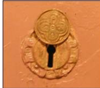
Prikaz funkcionalne brave na vanjskoj strani vratnice

Na prikazanim ukrasima koji prikrivaju brave jasno je da sef izvana nema sačuvanu izvornu polikromiju, već je bio prebojen u skladu s obližnjim namještajem.