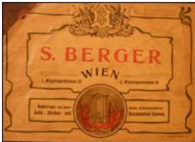
Naljepnica s Bergerova sefa, župni ured, Kaštel Štafilić

Slijedeći poznati proizvođač, čiji se rad ne može izostaviti u analizi tvoraca sefova koji su obilježili ovo područje je S. Berger.