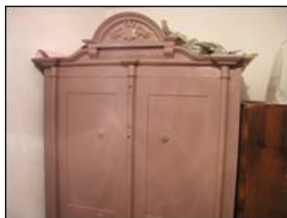
Gornji dio sefa iz župnog ureda u Kaštel Štafiliću

U župnom uredu u Kaštel Štafiliću nalazi se dvovratni sef proizvođača S. Bergera .